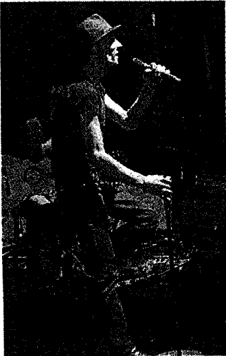
Mano Solo a tenu son public en haleine à l'occasion d'un concert apprécié.

Le Palais des congrès a fait le plein vendredi soir à l'occasion de la venue de Mano Solo. Écorché vif à ses débuts, le chanteur s'est adouci sans perdre de son talent de parolier. Samedi, il a fait un tabac.