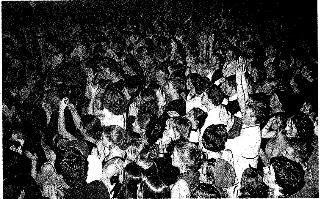
Près de 1 400 spectateurs se sont massés vendredi au Palais des congrès.

La voix rauque, il harangue son auditoire, la voix tendre, il le charme. Tantôt révolté, tantôt senti-